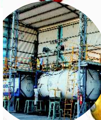
ISO Tank station