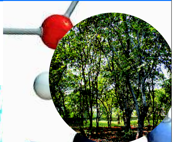
Greenbelt of 35000 trees

Email: inquiry@transpek.com | www.transpek.com