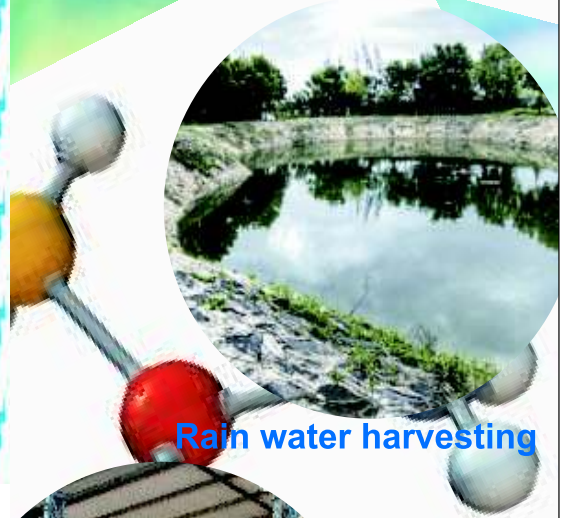
Rain water harvesting